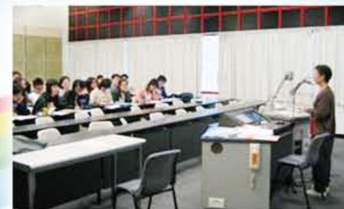
婦女大使在講座中分享