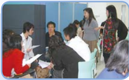
義工正在討論「男女角色是非題」，紛紛表達自己的意見

有興趣參與熱線或其他義工服務的朋友，歡迎到和諧之家網站 http://www.harmonyhousehk.org/ 填寫義工申請表，或致電2342 0072與職員聯絡。